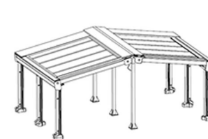
AUTOPORTANTE A DUE PENDENZE